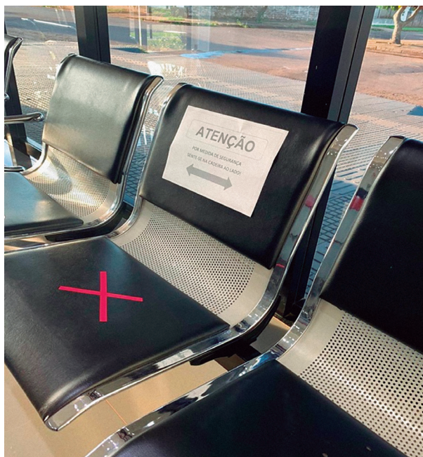
Figura 3 - Orientação em relação a ocupação das cadeiras em sala de espera.