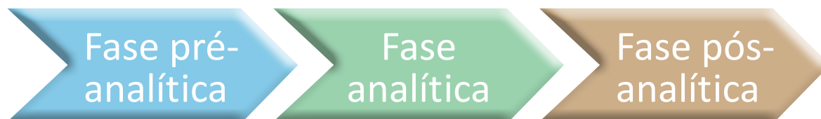
Figura 1: Etapas do exame laboratorial

Todo exame laboratorial passa por 3 fases sequenciais e interdependentes: fase pré-analítica, analítica e pós analítica, conforme ilustrado na figura 1.