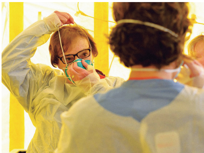
Figura 2 - Utilização de máscara e avental descartável